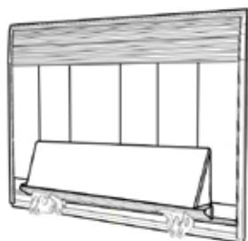
Plattformtyp K (ideal für Werbebeschriftung)